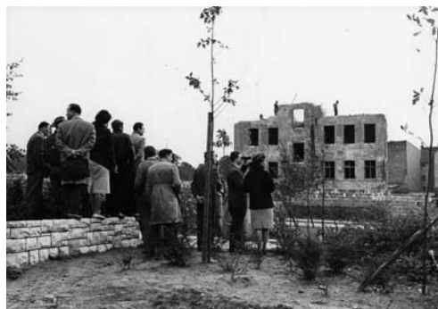
A 305: Erster Abriss eines Grenzhauses

Am frühen Morgen des 17. März 1964 flüchtete eine unbekannte Person an der Gartenstraße in den Westen. Die Flucht gelang, weil die Grenzposten entweder unaufmerksam waren, wie Vorgesetzte vermuteten, oder weil sie absichtlich in die andere Richtung sahen. Ein Bericht der Grenztruppen hält fest: „Die dort eingesetzten Posten versahen einen schlechten Grenzdienst und bemerkten nicht, dass der Grenzverletzer ca. 1 m vom Postenbereich entfernt die Grenzsicherungsanlagen überwand.“