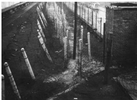
A 317: Weg der Grenzsoldaten durch den Stacheldraht

Auch von West-Berlin aus versuchten immer wieder Menschen aus unterschiedlichen Gründen, die Mauer zu überwinden. Am 29. Februar 1964 überkletterte ein unbekannter Mann an der Bergstraße die Grenzsperrern. Obwohl Grenzsoldaten ihn beschossen, konnte er ins Hinterland nach Ost-Berlin flüchten, wo er dann jedoch von der Volkspolizei verhaftet wurde.