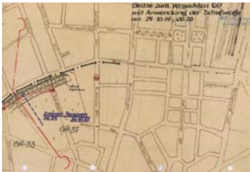
A 323: Skizze des Fluchtwegs