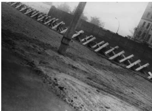
A 323: Spur der Flüchtlinge im Grenzstreifen

Karl-Heinz Br. und Gerd W. versuchten im Oktober 1969 über den Sophienfriedhof zu fliehen. Sie hatten den Hinterlandzaun, dessen Signalanlage nicht funktionierte, bereits überwunden und krochen über den Kontrollstreifen, als Grenzsoldaten im Wachturm an der Ackerstraße sie bemerkten. Die Grenzer begannen sogleich zu schießen; sie gaben zusammen 35 Schuss ab. Die Flüchtlinge, die unverletzt blieben, gingen hinter der Kraftfahrzeugsperrre in Deckung. Dort wurden sie festgenommen, nachdem einer der Flüchtlinge zunächst erfolglos versucht hatte, wegzukriechen. Nach Presseberichten wurde er mit einem Gewehrkolben niedergeschlagen. Die Flüchtlinge wurden in das Revier der Volkspolizei an der Brunnenstraße gebracht. Zwei der abgegebenen Schüsse hatten das Postamt am Nordbahnhof getroffen.